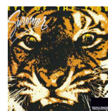
« Eye of the Tiger » Survivor