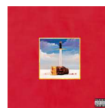
« All of the Lights » Kanye West, ft Rihanna