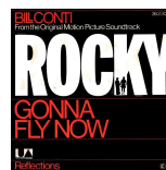
« Gonna Fly now » Bill Conti